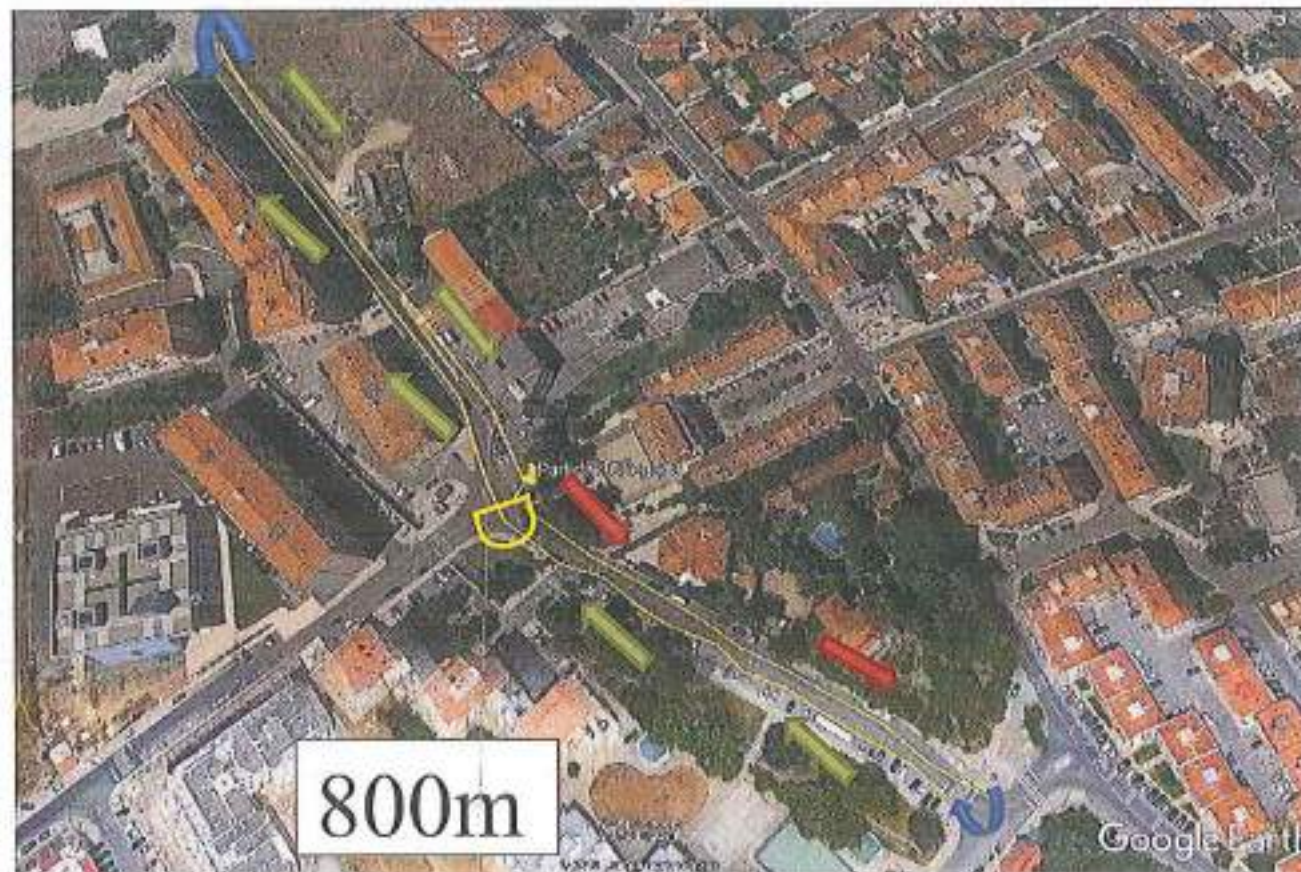
Percurso 4 (800m)

Às 10h20 partida no sentido descendente da Avenida dos Bombeiros Voluntários, no cruzamento a vira-se à esquerda para a Rua Professor Doutor Joaquim Fontes, de seguida vira-se na 2ª à direita para a Rua da Malva Rosa.