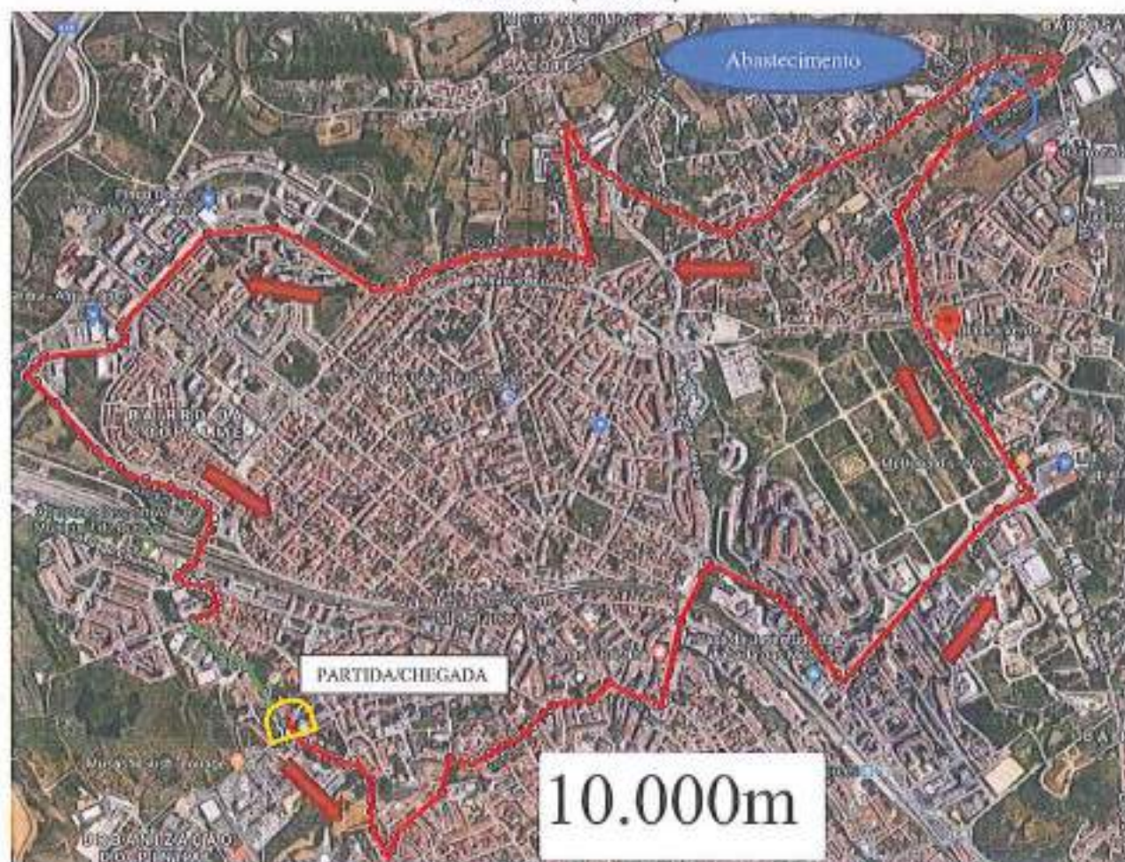
Percurso 1 (10 000 m)

Início junto às instalações dos Bombeiros Voluntários de Algueirão-Mem Martins no sentido descendente da Avenida dos Bombeiros Voluntários. Ao fundo, vira à esquerda na Rua Fernando Pessoa e logo de seguida à direita para a Rua Professor Dr. Joaquim Fontes, segue-se em frente pela Travessa dos Choupos, na rotunda vira-se à esquerda seguindo-se pela Estrada de Mem Martins, no cruzamento vira-se à direita seguindo-se pela Rua de Angola, na rotunda segue-se em frente no sentido descendente pela Rua Popular de Moçambique, no cruzamento vira-se à direita para a rotunda da Bela Vista (Praça da Paz), na rotunda segue-se pela esquerda sentido descendente da Avenida Vitorino Nemésio, na rotunda da estrela (junto à PSP), segue-se em frente no sentido ascendente pela Avenida Capitães de Abril, na rotunda segue-se em frente pela Avenida Amália Rodrigues, na rotunda vira-se à direita pela Estrada do Algueirão, vira-se à esquerda no cruzamento da Santinha, segue-se pela direita Estrada de Sacotes, na rotunda segue-se em frente continuando pela Estrada de Sacotes, vira-se à esquerda para a Estrada da Azeiteira, vira-se à direita para a Rua Reinaldo dos Santos, seguindo-se pela esquerda, vira-se à direita pela Rua Bernardo Marques, segue-se pela direita Rua Cidade de Leiria, segue-se pela