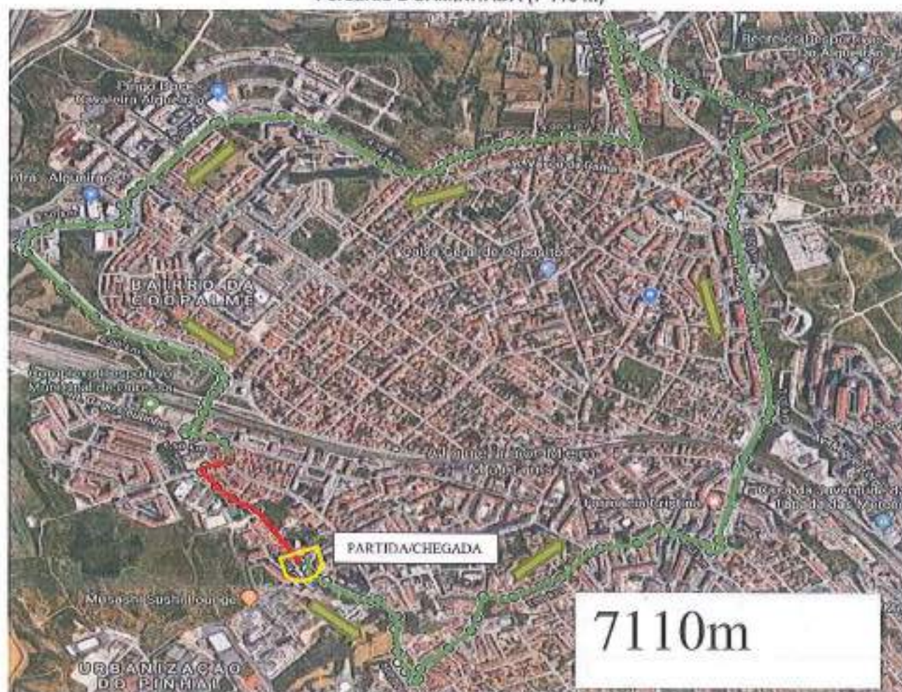
Percurso 2 CAMINHADA (7 110 m)

esquerda Rua Cidade de Beja, segue-se pela esquerda Rua Cidade de Faro, no cruzamento vira-se à esquerda e na rotunda vira-se à direita passando entre o Lidl e o Minipreço, segue-se em frente até à rotunda, vira-se à esquerda seguindo-se em frente, passa-se por debaixo do túnel em direção a Ouressa, segue-se pela esquerda para a Avenida Almirante Gago Coutinho, vira-se à direita para a Rua Doutor Joaquim Fontes, vira-se à direita para a Rua João Maria Magalhães Ferraz, vira-se à esquerda pela Rua Ferreira de Castro, segue-se em frente até meta.