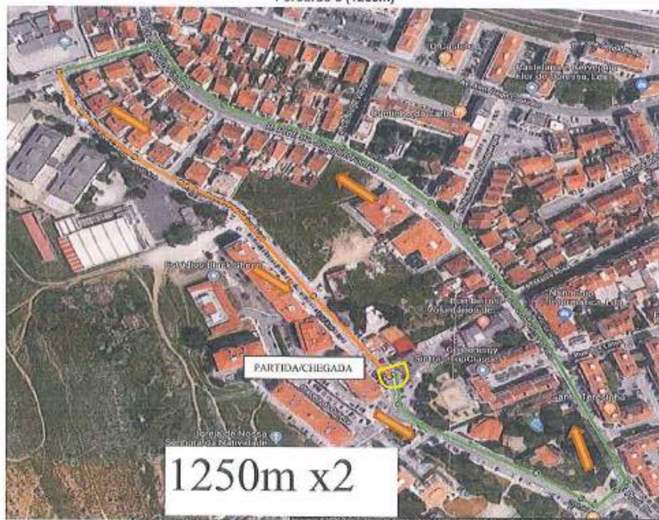
Percurso 3 (1250m)

Às 11h20 partida no sentido descendente da Avenida dos Bombeiros Voluntários, no cruzamento a vira-se à esquerda para a Rua Professor Doutor Joaquim Fontes, vira-se à esquerda para a Rua João Maria Magalhães Ferraz, vira-se esquerda a Rua Ferreira de Castro e segue-se até à Avenida dos Bombeiros Voluntários.